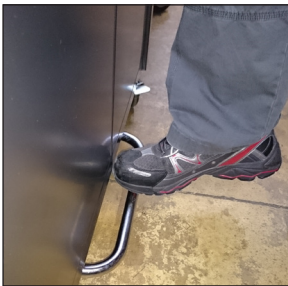
Auslösung bequem über das zentral integrierte Fußpedal