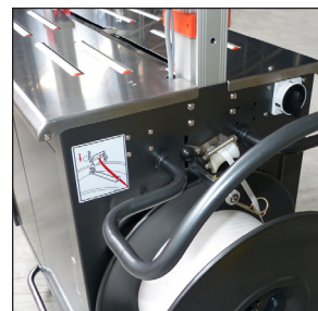
Außenliegender Abroller mit Bremse für leichtes Einlegen