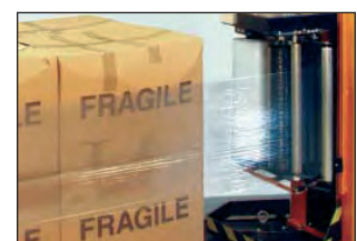
Alle SWS 18 serienmäßig mit elektromagnetischer Bremse.