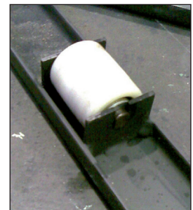
Kugelgelagerte Rollen zur Unterstützung des Tellers.