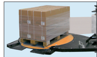
Optional mit offenem Drehteller zum direkten Einfahren lieferbar.