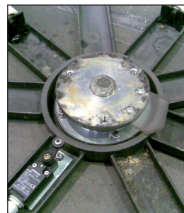
Extra großes Drehtellerlager für Jahre im Dauereinsatz.

Die besonders robuste Konstruktion bürgt für ein langes und wirtschaftliches Maschinenleben.