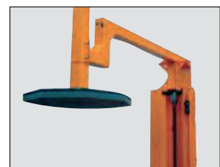
Durch zahlreiche Optionen ideal an Ihre Anwendung anpassbar.