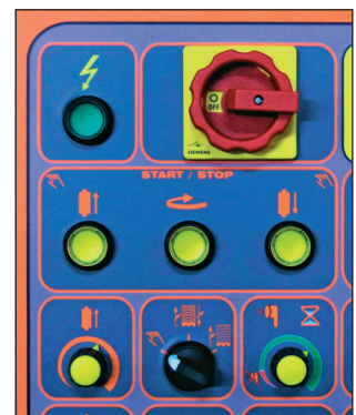
Besonders einfache Bedienung. Je Funktion ein Bedienelement.