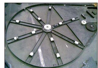
Massives Chassis aus Stahlblech mit vielen Querverstrebungen.