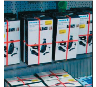
Vielseitig einsetzbar – ideal auch als Diebstahlschutz