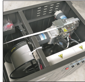
Automatische Auslösung durch Einschieben des Bandendes