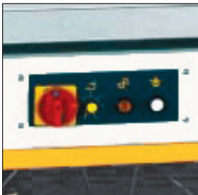
Übersichtliches Bedienfeld – sehr einfache Bedienung