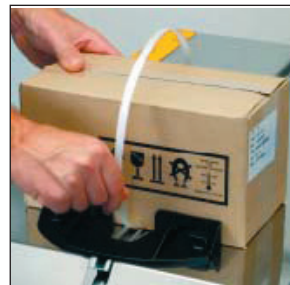
Automatische Auslösung durch Einschieben des Bandendes